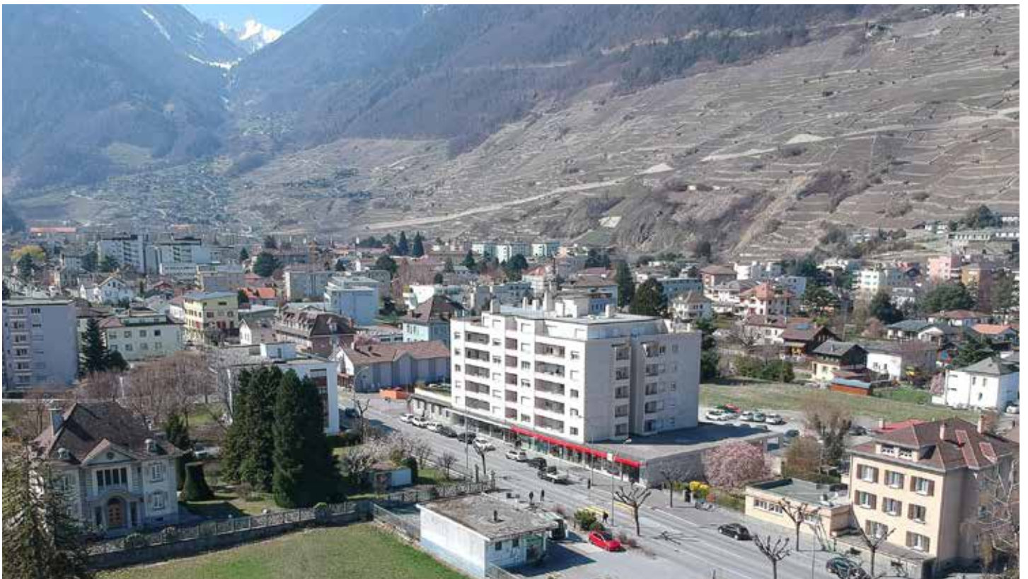
CI-DESSOUS : VUE DE L'AVENUE DU GRD-ST-BERNARD, 2019