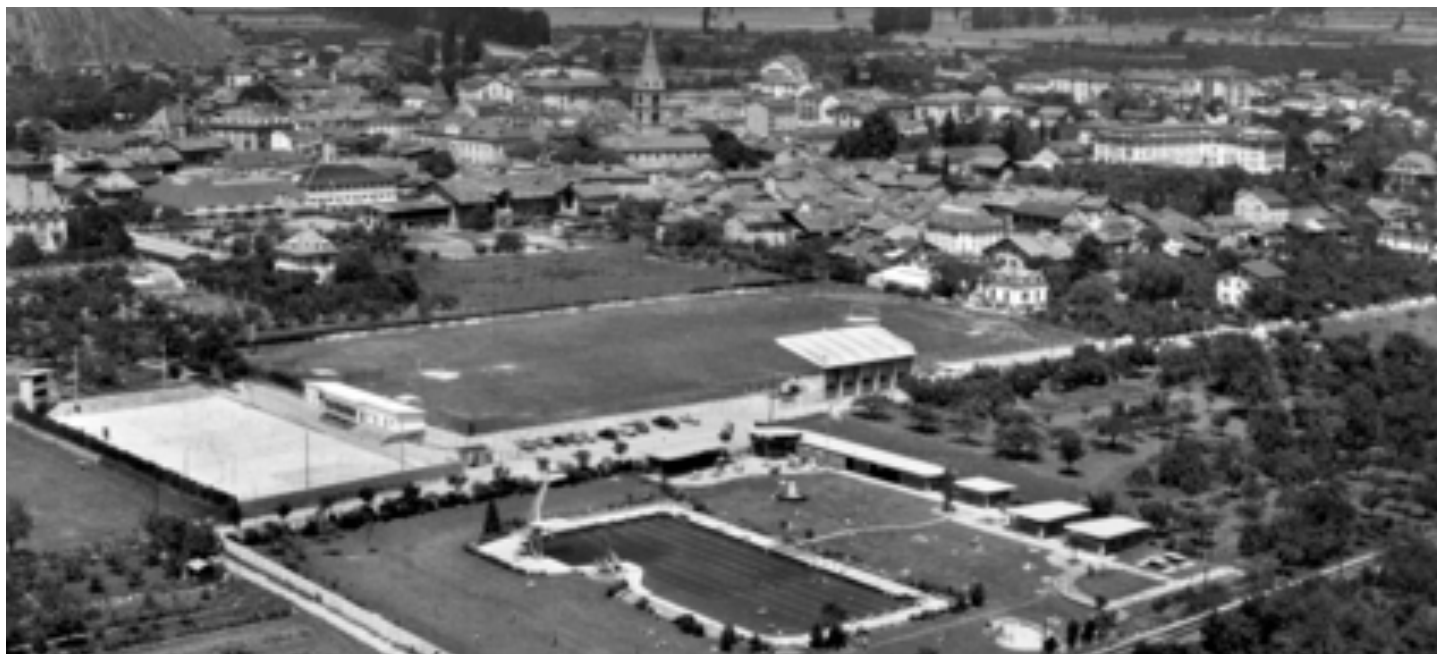
VUE DE MARTIGNY AVEC SON PARC DES SPORTS, VERS 1956

Remarque : les sous-chapitres peuvent encore subir des changements.