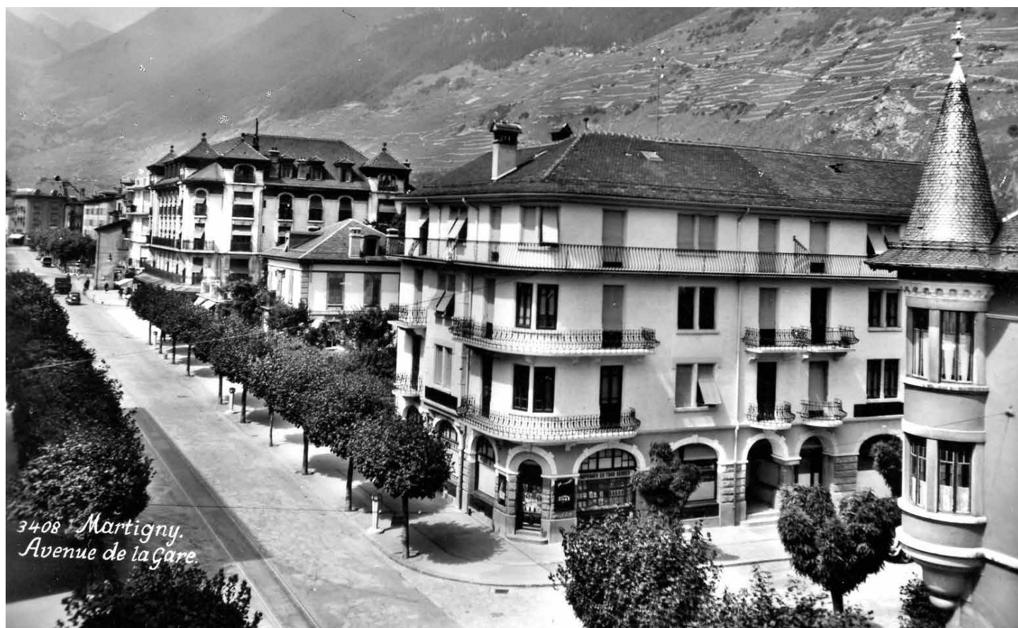
AVENUE DE LA GARE DE MARTIGNY, VERS 1935