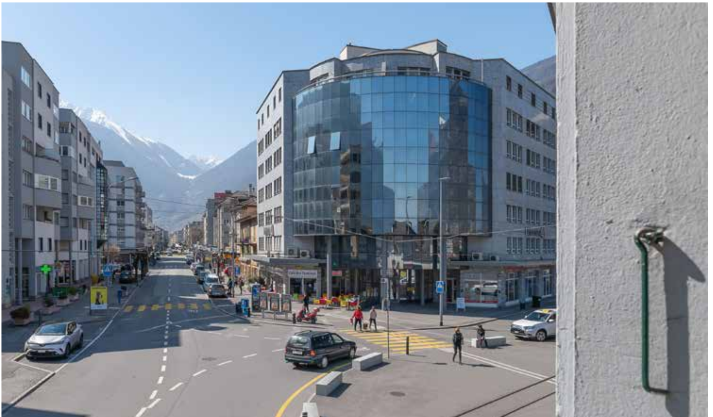
LE GARE DE MARTIGNY, 2019