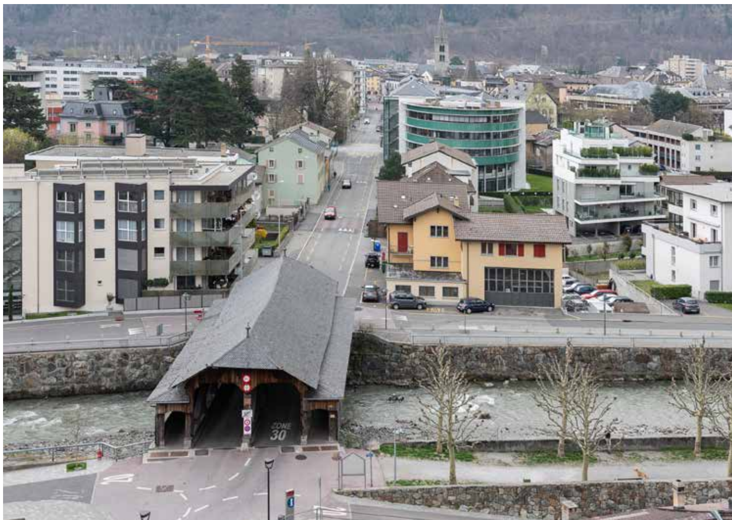
LE PONT DE LA BÂTIAZ ET DE LA RUE MARC MORAND, 2019

Depuis 1959, avec des hauts et des bas, notre association s'est engagée à la défense et à la sauvegarde du patrimoine bâti de Martigny. Depuis 2001, elle porte même son attention à tous les différents patrimoines locaux tant anciens que nouveaux. Après 60 ans d'activité, il est temps de dresser un bilan.