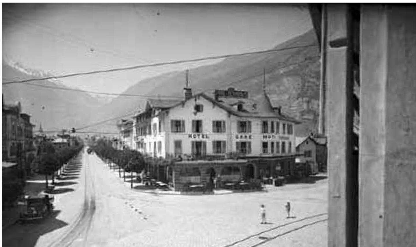
LE GARE DE MARTIGNY, VERS 1930

Richement illustré, notre ouvrage est destiné à l'ensemble de la population martigneraise. Martigny étant une des principales villes du canton, son évolution architecturale et patrimoniale est susceptible d'intéresser un grand nombre de Valaisans, ainsi que les professionnels de l'urbanisme, de l'architecture, du patrimoine et de la culture.