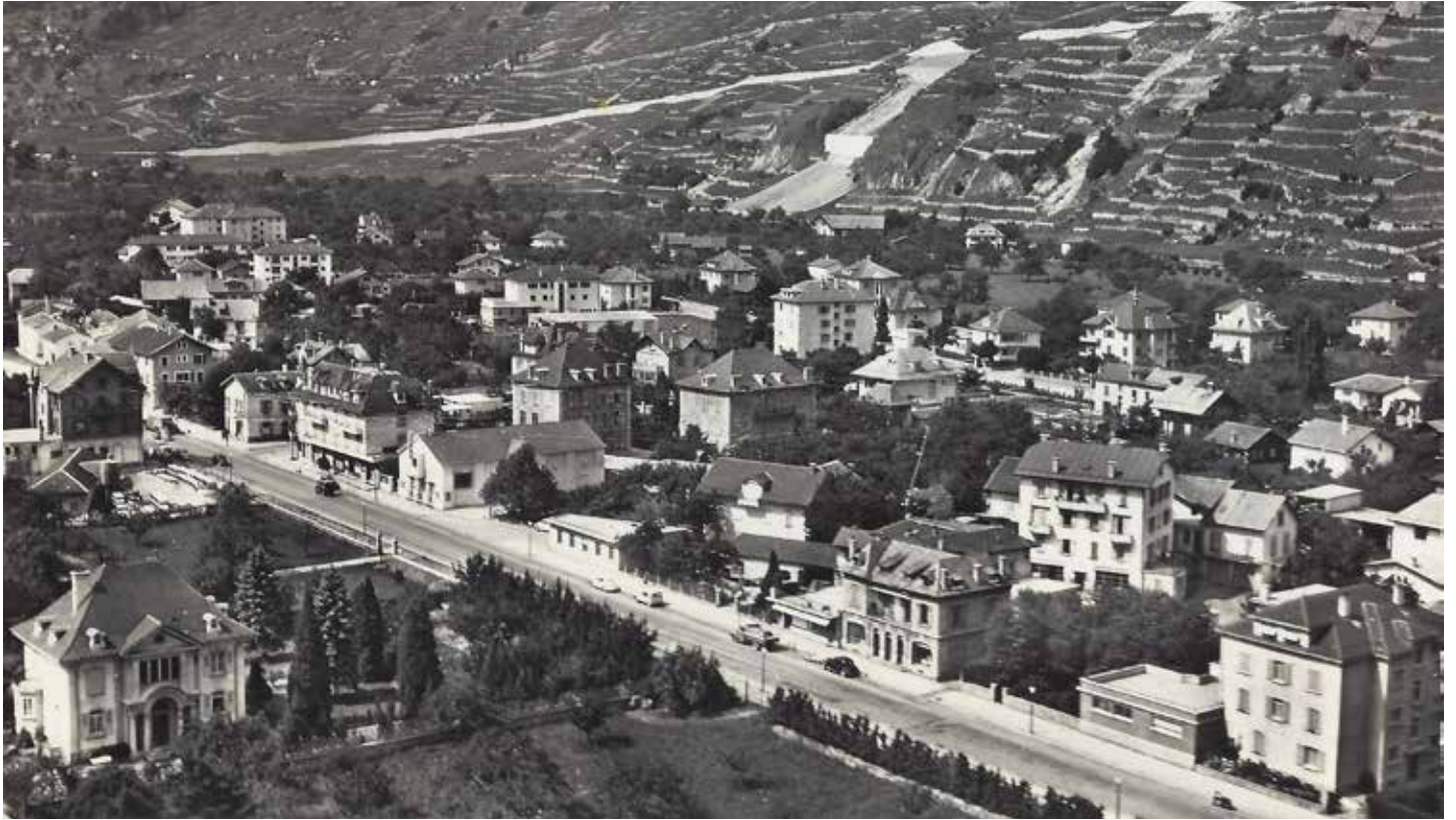
CI-DESSUS : VUE DE L'AVENUE DU GRD-ST-BERNARD, 1960